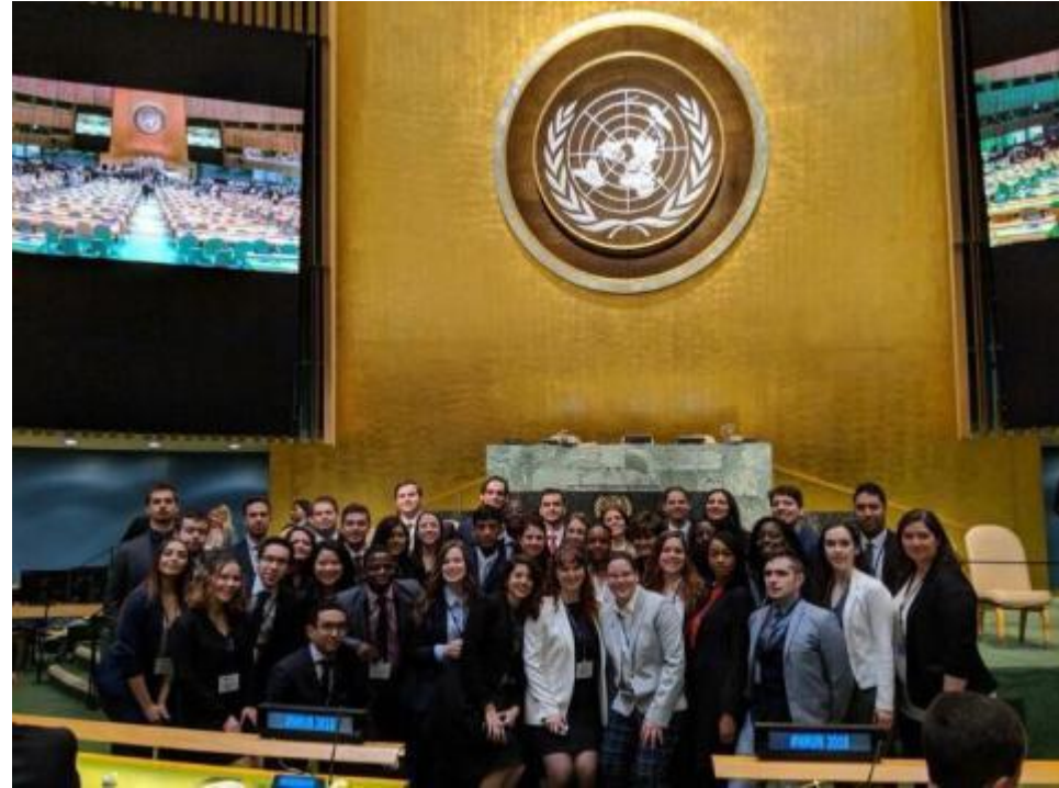
LA DÉLÉGATION DE L'ESG SUR LA PLUS HAUTE MARCHÉ DU PODIUM À LA SIMULATION DES NATIONS UNIES – MARS 2018